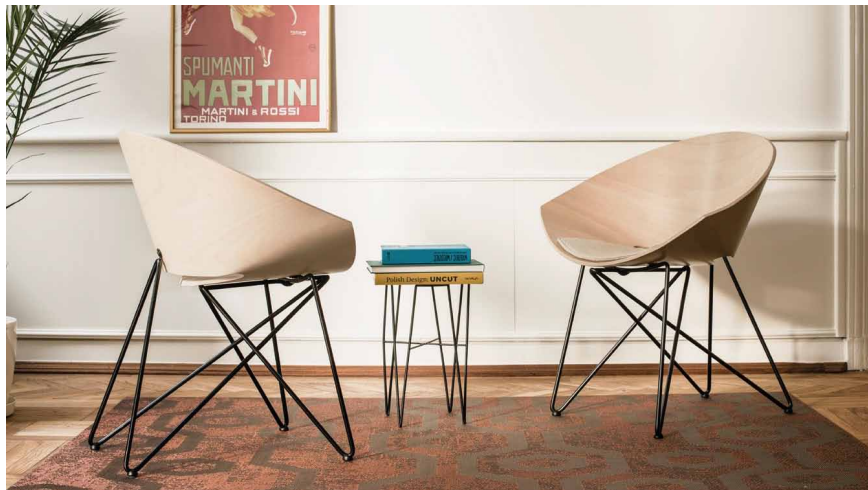
Křeslo RM56 WOOD se sedadlovou skořepinou zhotovenou z tvarované překližky